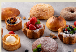
毎日約70種類以上の焼き立てパンが並びます

ホテルアークリッシュ豊橋が手掛けるパン屋。 無添加のパン生地、国産小麦100%使用。 東三河の食材を中心につかった安心して食べられる “豊市パン”がココラアベニューから、 emCAMPUS WESTにこの度移転オープンいたします。 イートインコーナーもあり、ゆっくりと焼き 立てパンを味わうことができます。毎日の食パンや、 季節ごとの美味しい食材を使用したこだわりの焼き 立てパンをお楽しみください。